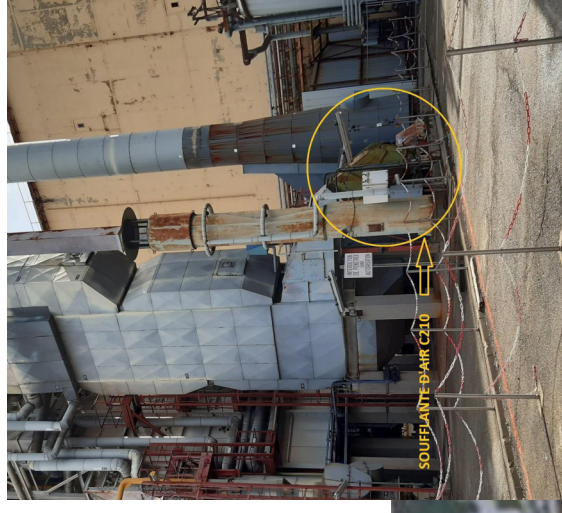
Soufflante d'air de combustion